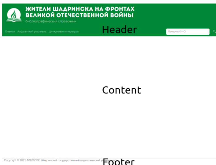
Рис. 1. Вид главной страницы базы данных

В верхней части сайта ( header ) размещены логотип, навигация между основными разделами и форма поиска, что делает взаимодействие с ресурсом простым и интуитивно понятным.