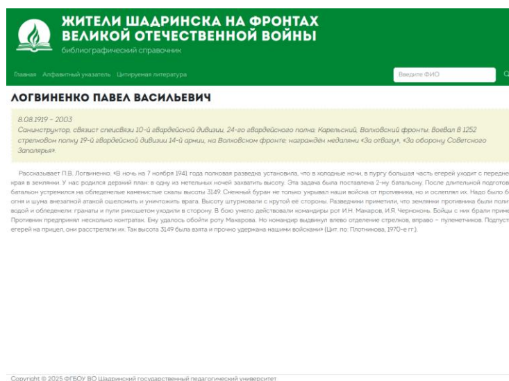
Рис. 2. Пример страницы базы данных

В блоке content отображается информация в зависимости от типа страницы [8]. На главной странице представлено предисловие автора из научной работы, в разделе алфавитного списка отображается список людей в алфавитном порядке, на странице списка использованной литературы приведены источники, использованные при подготовке материалов. Страница со статьей о человеке содержит биографическую информацию и текст статьи (рис. 2).