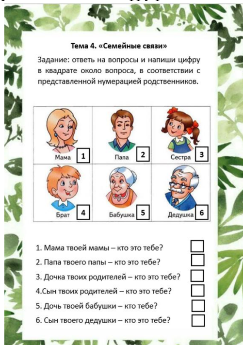
Рис. 2. Тема 4 «Семейные связи»

После продолжается работа по перестраиванию мышления детей с наглядно-образного в словесно-логическое. Детям дается задание, где в доступной для них форме, необходимо ответить на вопрос и поставить цифру родственника (рис.2).