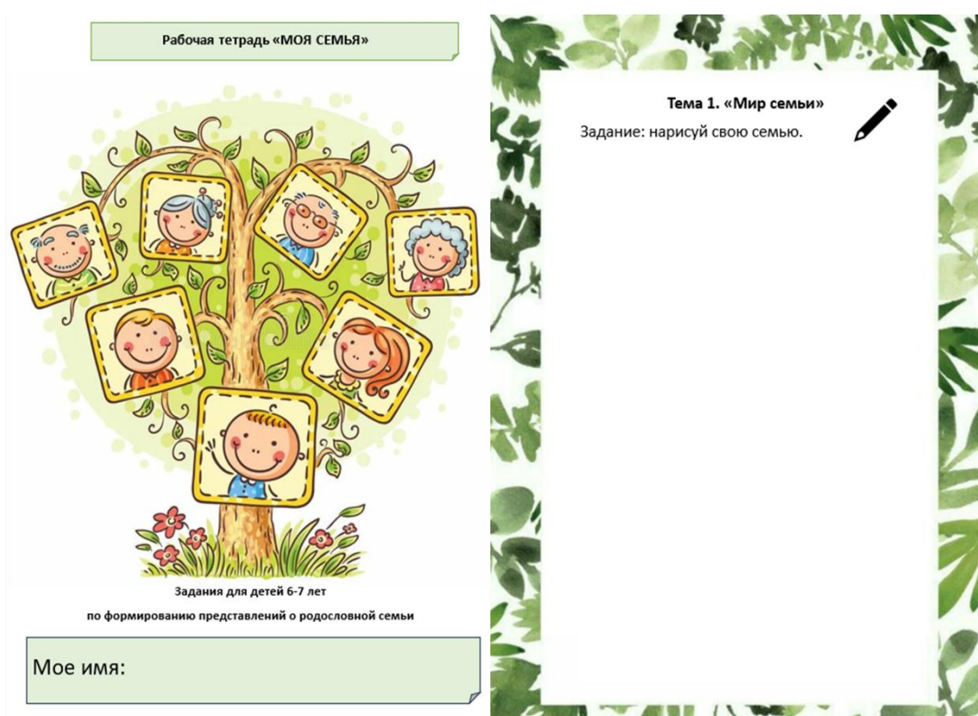
Рис. 1. Титульный лист и тема 1 «Моя семья»

ребенком собственного генеалогического древа семьи. Работа начинается с рисунка ребенка, где он может отразить собственное видение своей семьи (рис.1).