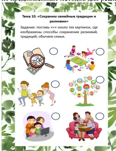
Рис. 4. Тема 10 «Сохраним семейные традиции и реликвии»

Подводящим практическим заданием к созданию собственного генеалогического древа является тема «Сохраним семейные традиции и реликвии» (рис. 4). На данном этапе детям предстоит познакомиться с различными способами сохранения семейных традиций и реликвий, а также выбрать один из предложенных методов для реализации.