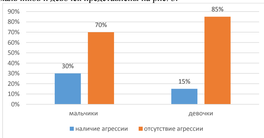
Рис. 3. Результаты выявления агрессии на фрустрацию у мальчиков и девочек младшего школьного возраста (по методике С. Розенцвейга)

Результаты проведенной методики С. Розенцвейга «Детский тест фрустрационных реакций» среди мальчиков и девочек представлены на рис. 3.