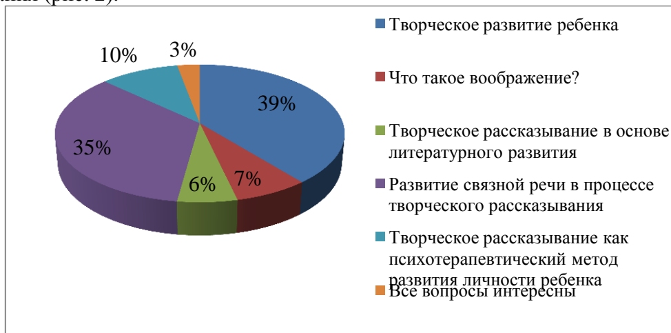
Рис. 2. Актуальные родительские запросы по проблеме речетворческих способностей дошкольников

По данным исследования, актуальными запросами от родителей стали: особенности творческого развития ребенка (что такое творчество, как определить творческие способности, как их развивать) и развитие связной речи детей в процессе творческого рассказывания (рис. 2).