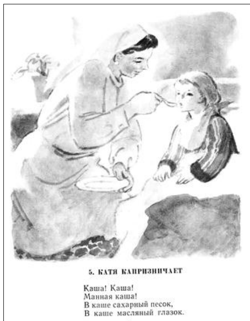
5. КАТЯ КАПРИЗНИЧАЕТ

Итак, желание «беспричинно» плакать Катя преодолела с помощью больничной няни, капризный отказ в поедании «невкусной, но полезной» пищи Кате помогла преодолеть больничная сестра. Наступает искушение суккой, желанием праздника.